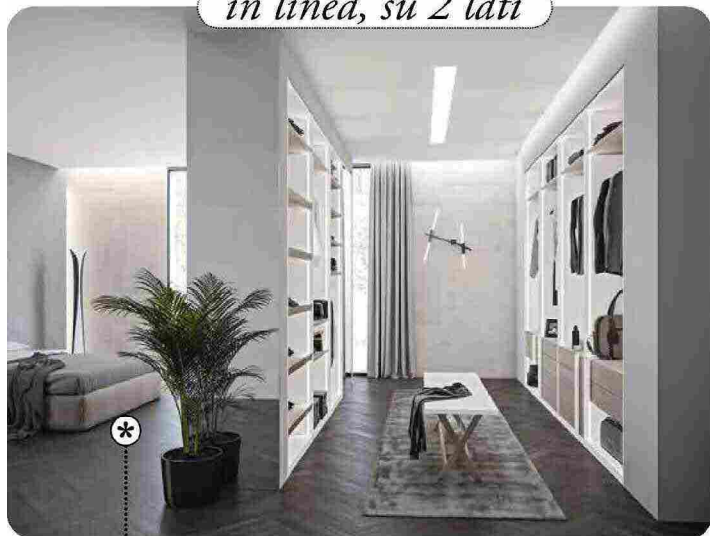
in linea, su 2 lati

Nelle camere di forma regolare e profonde almeno 460 cm si possono inserire due strutture lineari e parallele davanti al letto, lasciando tra loro uno spazio fruibile di minimo 60 cm e creare una cabina walk-in su due lati profonda 180 cm. Qui le due strutture a spalla CA09 in nobilitato Bianco Seta hanno piani, cassetti e portascarpe in Rovere Nodato [Giessegi, a sx cm 285,4x58,3x262h a dx cm 379,6x58,3x262h € 10.159].