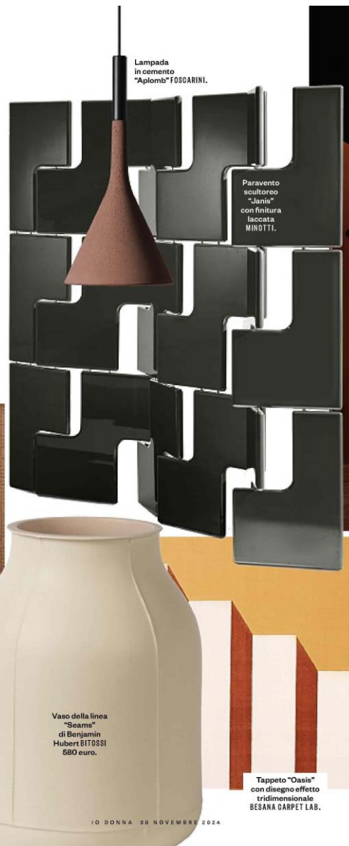
Lampada in cemento "Aplomb" FOSCARINI.