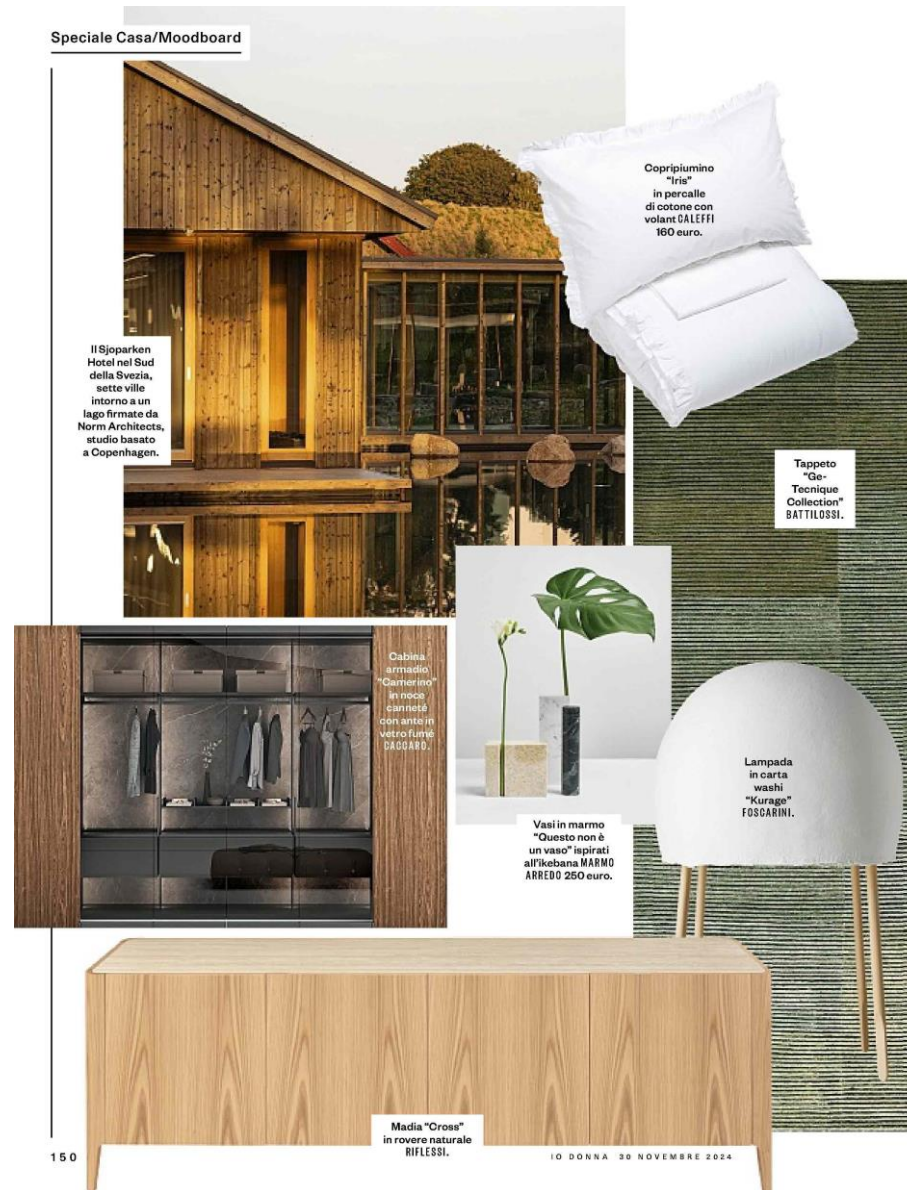
Il Sjøparken Hotel nel Sud della Svezia, sette ville intorno a un lago firmate da Norm Architects, studio basato a Copenhagen.