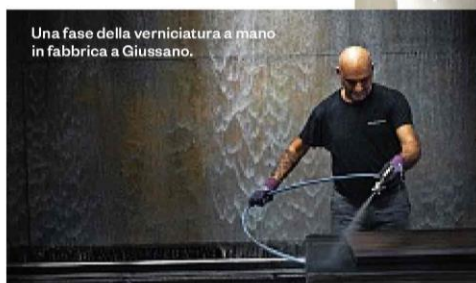
Una fase della verniciatura a mano in fabbrica a Giussano.