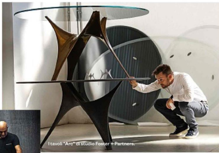
I tavoli "Arc" di studio Foster + Partners.

Anniversari, eventi, tendenze, vetrine, sistemi evoluti per trasformare lo spazio. Dentro e fuori il Salone del Mobile, la casa è già un passo avanti