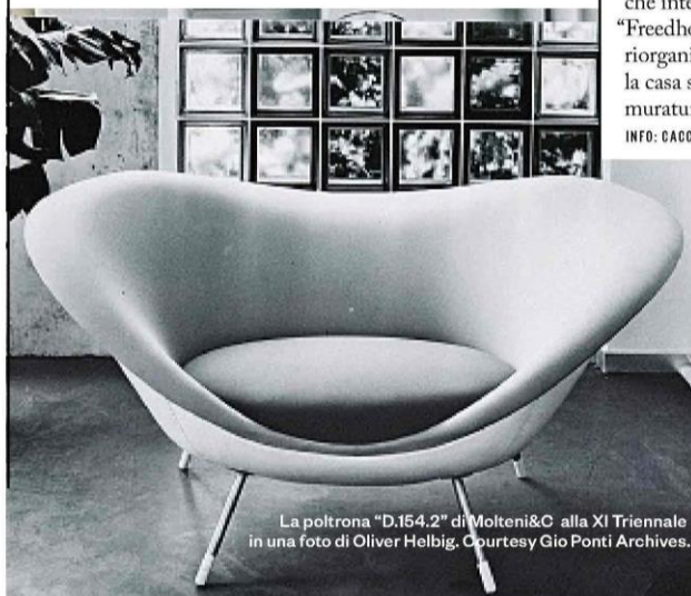
La poltrona "D.154.2" di Molteni&C alla XI Triennale in una foto di Oliver Helbig. Courtesy Gio Ponti Archives.

Fino al 21 aprile gli arredi trasformisti di Campeggi saranno in dialogo con arte e fotografia all'interno di BiM, un complesso in fase di recupero nel quartiere Bicocca a Milano. Salone Calmo. A Showcase of Campeggi Objects è a cura di C41 e del collettivo di creativi SPECIFIC, tra cui l'artista Patrick Tuttofuoco. Ingresso da Viale dell'Innovazione 3. INFO: BIM-MILANO.COM