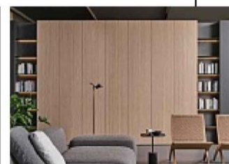
"Freedhome" di Caccaro in canneté rovere.